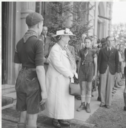
Koningin Wilhelmina voor de ingang van Sacré Coeur, het tijdelijke gemeentehuis van Arnhem, 21 juni 1945.

eerste keer dat dat gebeurde was op 7 augustus 1883, een paar maanden na de opening van de Planten- en Vogeltuin. Koning Willem III was er beschermheer van en kwam er samen met koningin Emma naar toe om een middagconcert van de kapel van de