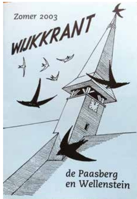
Gierzwaluwen horen bij de Paasberg

zijn. Daarna is het wachten tot de gierzwaluwen de nieuwe woningen in gebruik nemen.